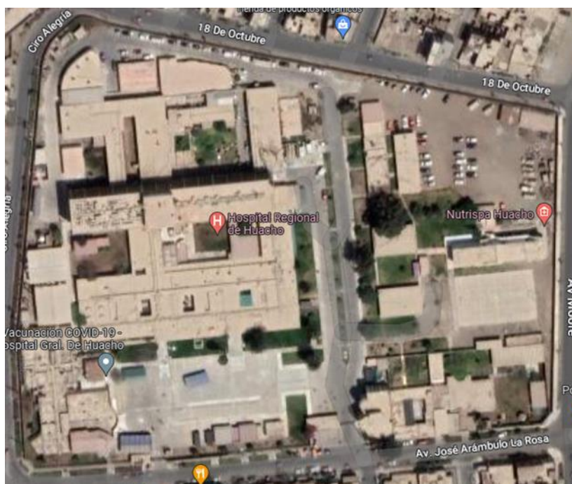
IMAGEN N°01: Ubicación de EMED

sala de reuniones, 01 almacén interno y 01 almacén con recursos movilizables para la continuidad operativa.