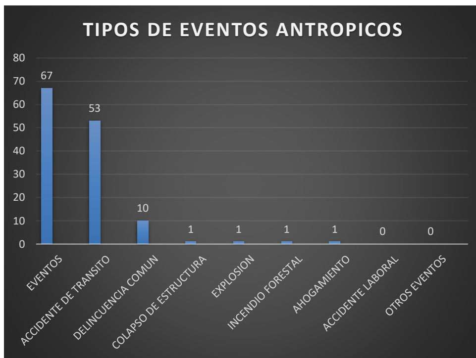
Tabla N°4 Frecuencia Acumulada Eventos Antrópicos