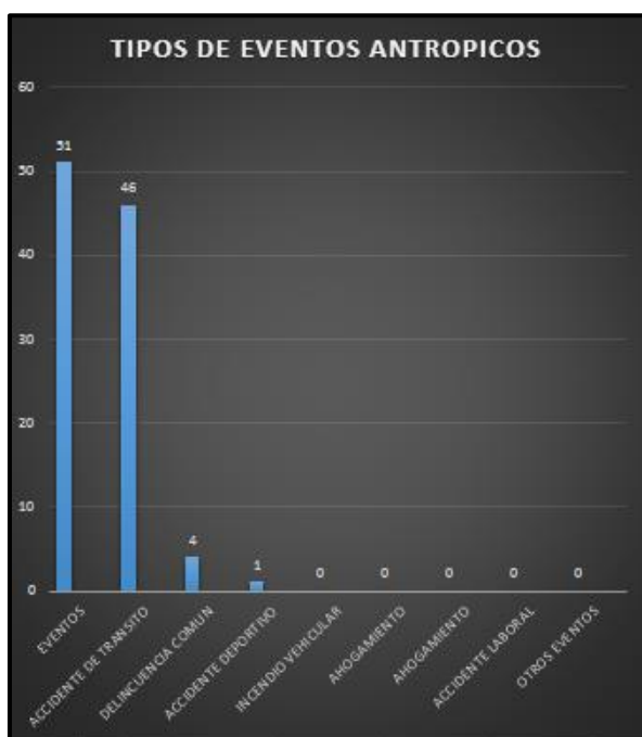
Tabla N°4 Frecuencia Acumulada Eventos Antrópicos