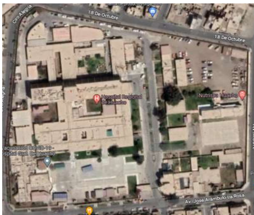
IMAGEN N°01: Ubicación de EMED

El EMED Salud Hospital Huacho Huaura Oyón se encuentra ubicado en el primer nivel de edificación, libre de obstáculos para su adecuado ingreso o evacuación. El espacio físico se conforma por: 01 ambiente sala de reuniones, 01 almacén interno y 01 almacén con recursos movilizables para la continuidad operativa.