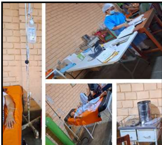
Implementación y operativización atención Emergencia Micro red Huaura