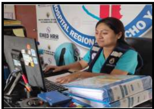
Monitoreo accidente tránsito, reporte de lluvias Hospital Regional de Huacho y Microred Huaura Oyón Fecha: 31/03/24 al 01/04/2024