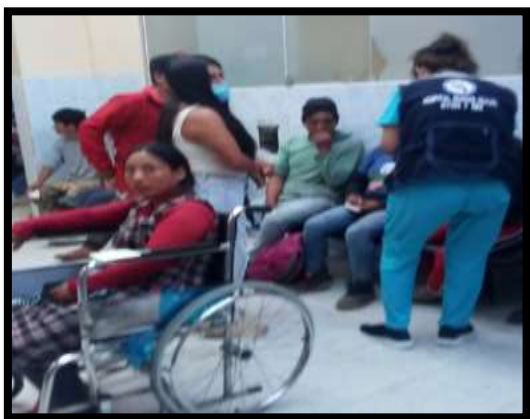
Monitoreo accidente transito Hospital Regional de Huacho Fecha: 29/03/2024