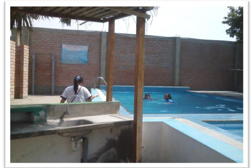
Hotel La Casa del Algodón