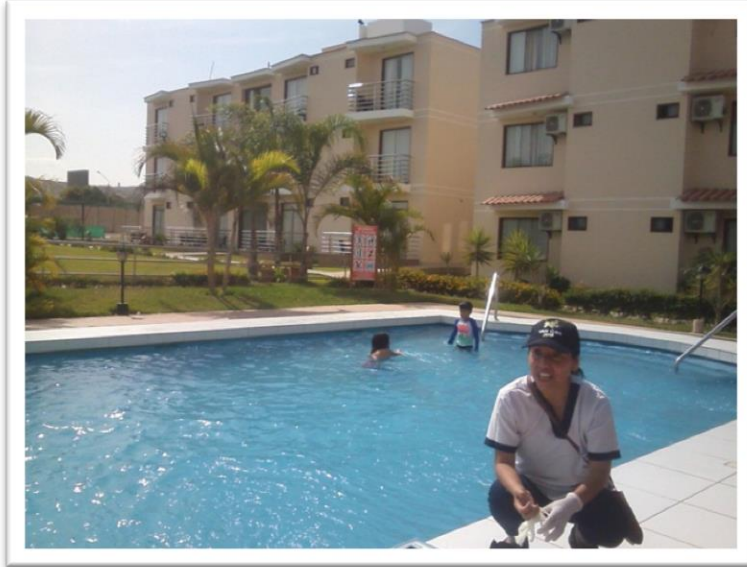
Hotel Sol y Palmeras