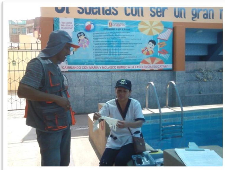
I.E.P Nuestra Señora de la Merced